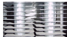
specielle former for rør